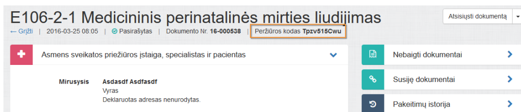
3 paveikslas. Pažymos peržiūros kodas

Sistema sugeneruoja pažymos peržiūros e. sveikatos viešajame portale kodą, kuris parodomas atnaujintame medicininės pažymos peržiūros lange.